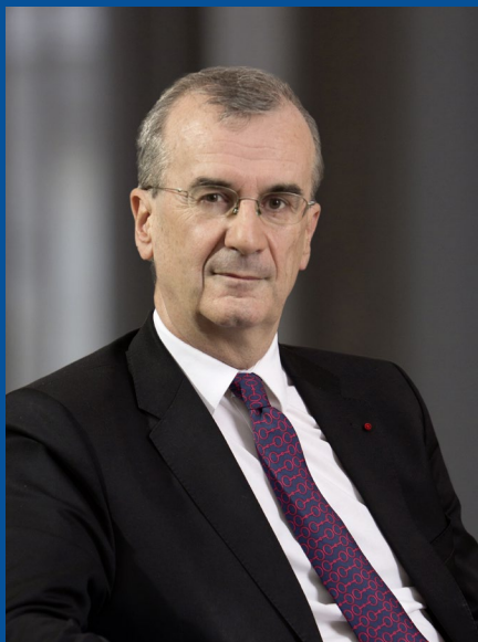
FRANÇOIS VILLEROY DE GALHAU Gouverneur de la Banque de France, Président de l'ACPR